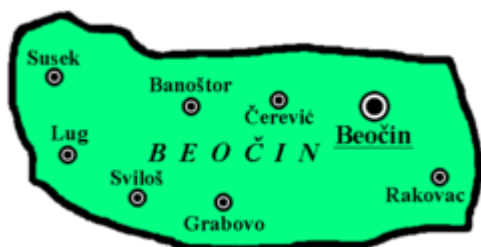
Слика број 2: Насеља у општини Беоцин,

Черевих је село које је саграђено на ушћу Черевихког потока у Дунав. Спада у подунавско насеље. Село је 7 км удаљено од општинског центра.