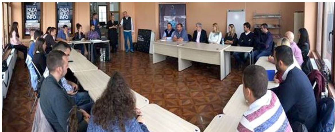
Letnje škole kao platforma za buduće ideje saradnje

Saradnja između ovih kancelarija za mlade i mladih iz dijaspore uspostavljena je tokom trodnevnog foruma mladih, koji je održan u maju 2016. Više od 40 učesnika iz kancelarija za mlade i mladih iz dijaspore iz Minhena, Beča, Istanbula, Bratislave i Pariza učestvovalo je u forumu koji je poslužio da definiše budući model saradnje. Dati su predlozi zajedničkih aktivnosti, koji su zatim realizovani u okviru programa razmene - letnjih škola, koje su okupile predstavnike mladih iz dijaspore i poslužile kao platforma za buduće ideje saradnje. Više od 150 učesnika je učestvovalo u letnjim školama.