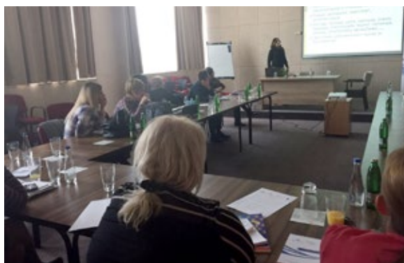
Trening za centre za socijalni rad održan i u Pirotu