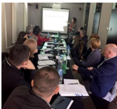
Dvodnevna radionica održana u Vranju

Tokom 10. i 11. aprila 2017. radionice su održane u Vranju, a 24. i 25. aprila u Pirotu.